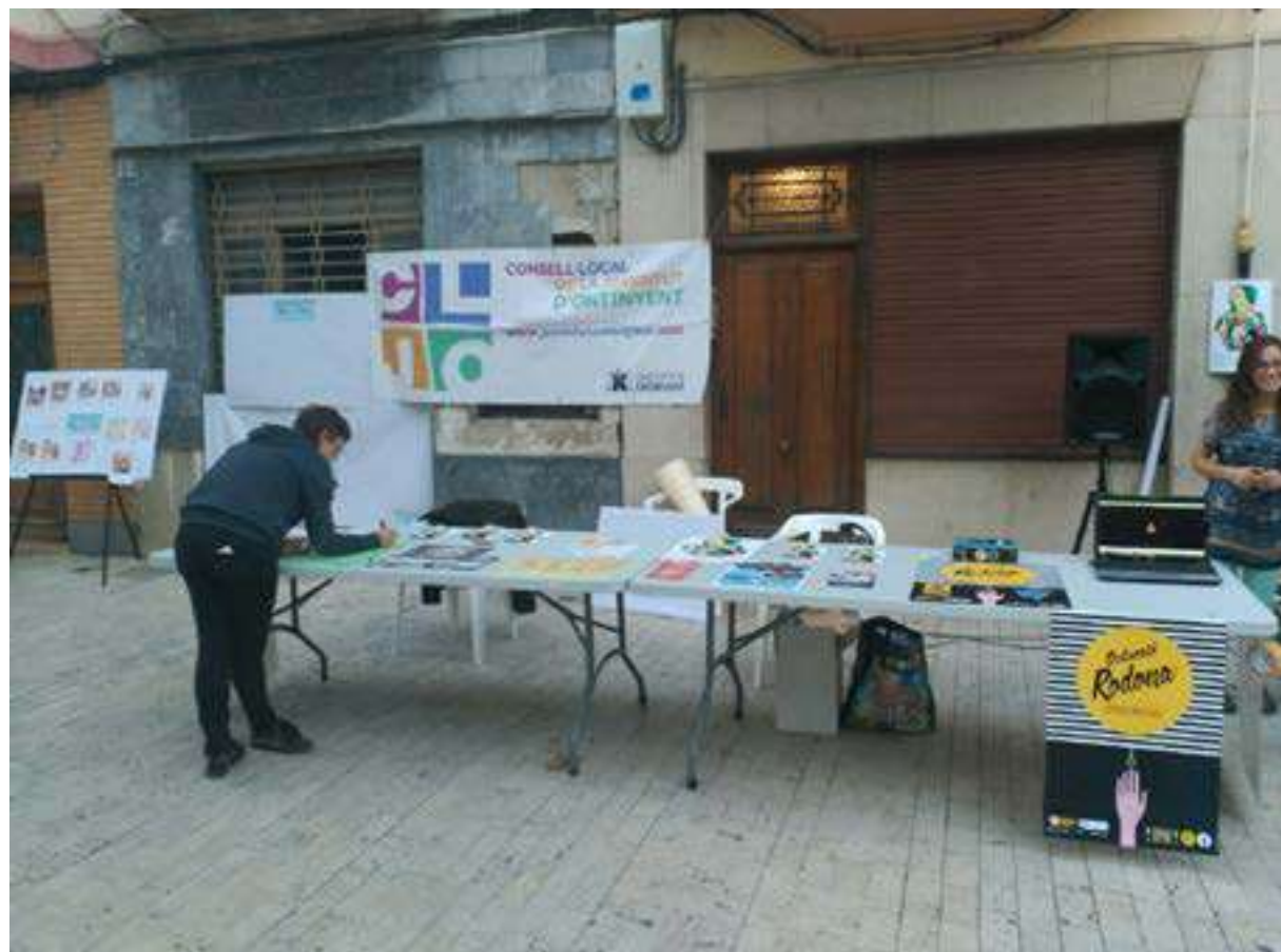
V Fira d'Associacions del CLJO.

La participació juvenil és fonamental per a aconseguir una societa plenament democràtica.