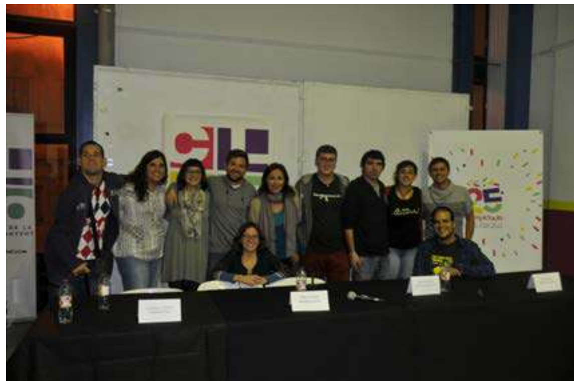
Membres del CLJO en la presentació del 25 aniversari de l'entitat.