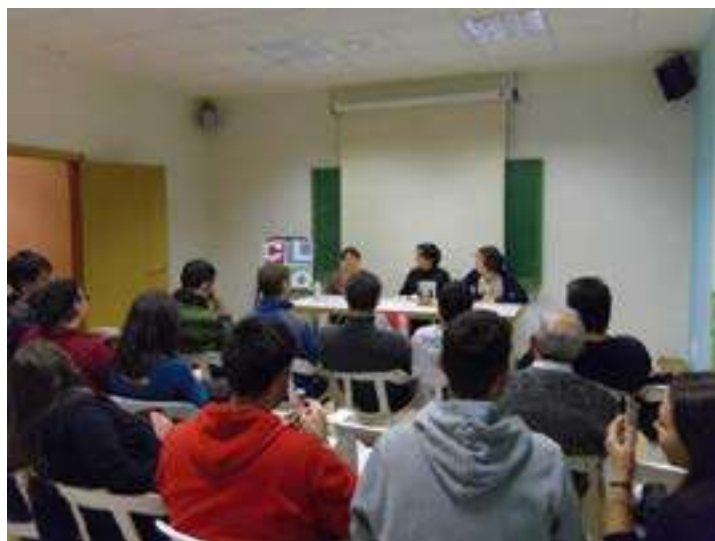
Activitats emmarcades dintre del Nadal Jove 2012