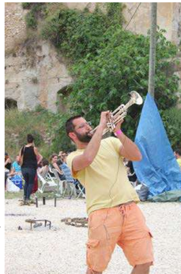
Actuació en Les Paelles Joves del 2015.

Així des del CLJO es va llançar la #pasquajove oferint una alternativa d'oci al jovent ontinyentí i de voltants en les vacances de pasqua, per evitar així, que aquestes i aquests hagueren de sortir d'Ontinyent cercant l'oci que no s'oferia a la ciutat. Amb el pas de les edicions, l'acceptació del públic va augmentar, fins a convertir-se en una activitat indispensable per al nostre jovent. Malauradament, amb la vinguda de la pandèmia, com amb moltes altres activitats, aquesta es va veure paralitzada, sent l'última edició la corresponent a l'any 2019..