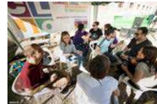
Membres del CLJO a les #PaellesJoves

Dintre de la Pasqua Jove, el CLJO en col·laboració amb l'Ajuntament d'Ontinyent i la Diputació de València celebrava les #PaellesCLJO. Aquesta activitat se centrava a organitzar una trobada de gent jove on cada una d'aquestes persones s'inscrivía amb el seu grup o amb la seua colla d'amics i amigues. Durant aquesta jornada es tractava de fer una paella en productes comprats en el comerç local. A més, aquest dia de comboi estava acompanyat de música i bon ambient.