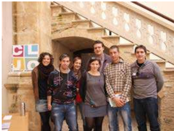
Membres del CLJO a la fira d'associacions del 2012

P er a estar actualitzat i actualitzada de les noves activitats pots consultar tota la informació a la nostra pàgina web i les nostres xarxes socials. Sols has d'accedir al nostre web www.joventutontinyent.com . Ens pots trobar en: Facebook ( facebook.com/conselljoventutontinyent ), en Instagram (@cljo_ontinyent) i en Twitter (@CLJO_Ontinyent). Des del CLJO considerem fonamental la nostra presència a les diferents xarxes socials. El temps evoluciona i nosaltres també, per aquest motiu, també podem resoldre els teus dubtes en aquests canals!