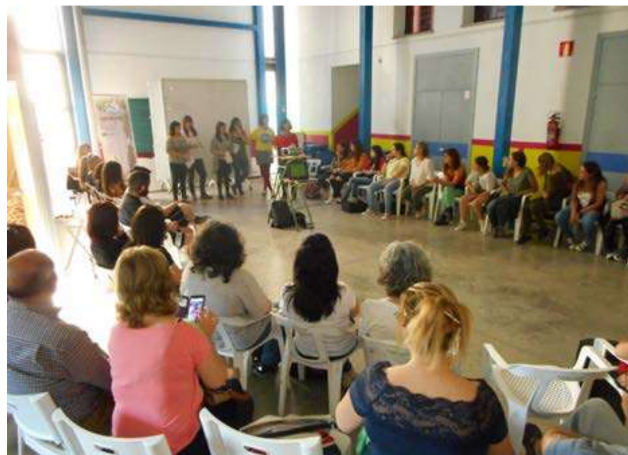
Taller per a visibilitzar la desigualtat de gènere.

U na associació és una agrupació de tres o més persones constituïdes de forma estable centrada en un objectiu col·lectiu i comú, i que es dota d'Estatuts per regular el seu funcionament. Les associacions són entitats independents que s'organitzen democràticament i que no tenen ànim de lucre. Una associació juvenil necessita que els seus membres siguin els i les joves d'edats compreses entre els 14 i els 30 anys complits. Per una banda, és un espai privilegiat per a l'aprenentatge de la participació i la pràctica democràtica entre la joventut. Cal promocionar aquelles entitats que contribueixen a la transformació social i el benestar comú mitjançant l'acció organitzada, col·lectiva i solidària dels seus membres. Per altra banda, a l'hora de constituir una associació juvenil és molt important que les persones sòcies fundadores reflexionen i tinguin clar què és el que volen aconseguir i com ho poden fer des de l'àmbit associatiu.