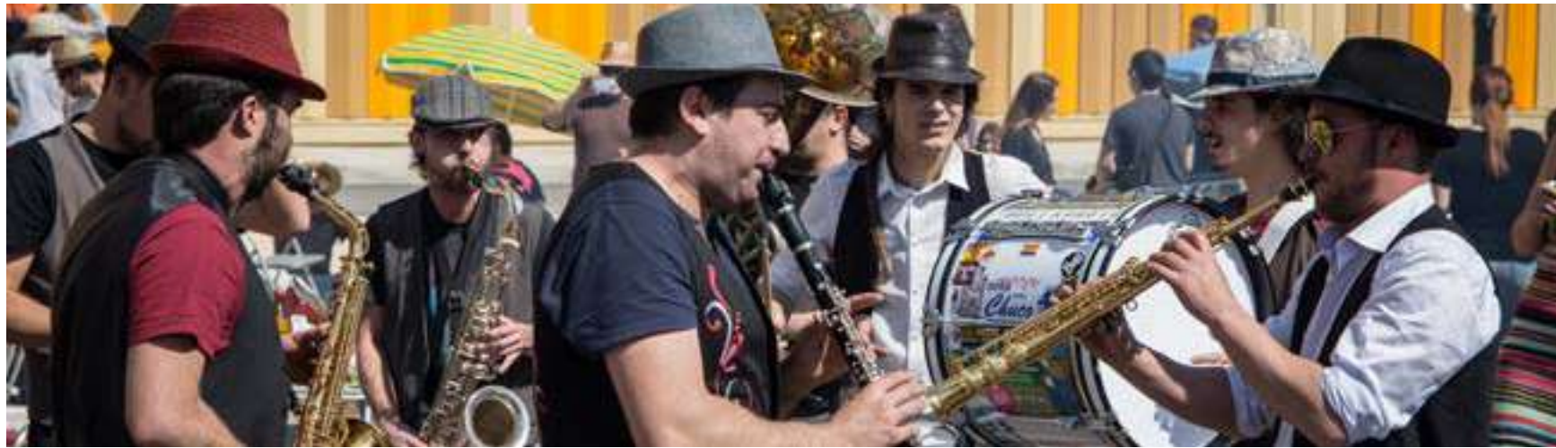
Paelles Joves dintre de la Pasqua Jove al 2017.