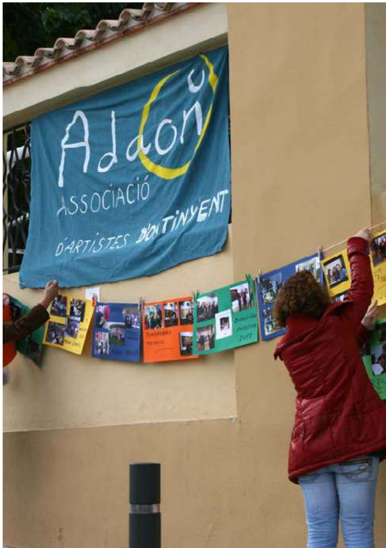
Imatge de la fira d'associacions del 2012.