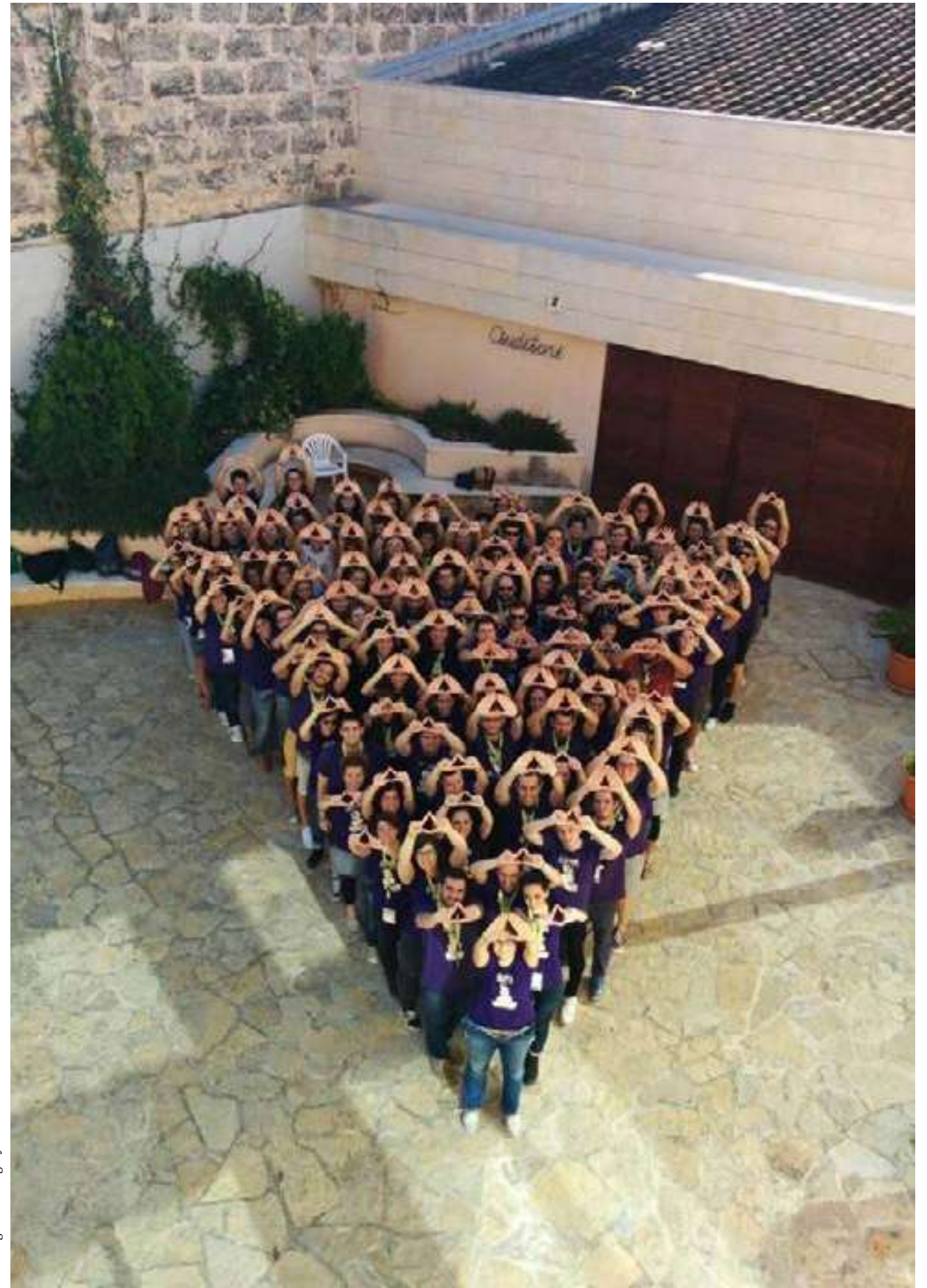
Imatge del Triangle Jove al 2014

En el moment de l'edició d'aquesta revista, el CLJO es troba en ple procés de renovació de la seua Comissió Permanent.