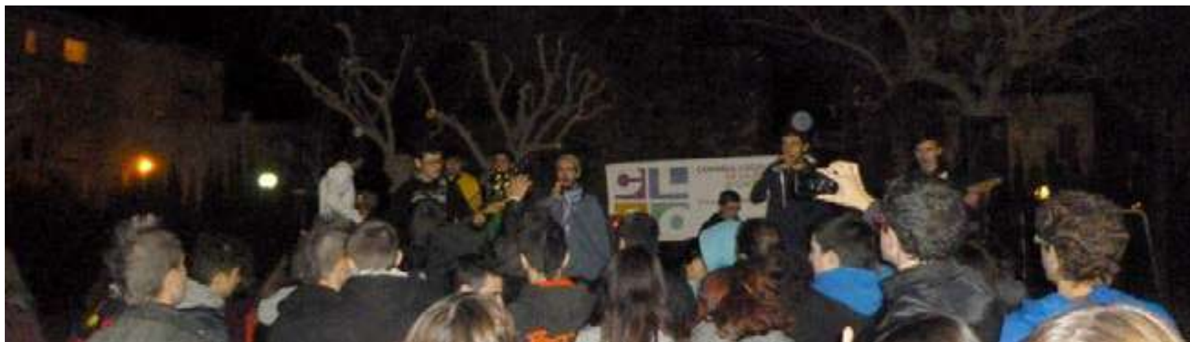
Nadal Jove a l'any 2015.