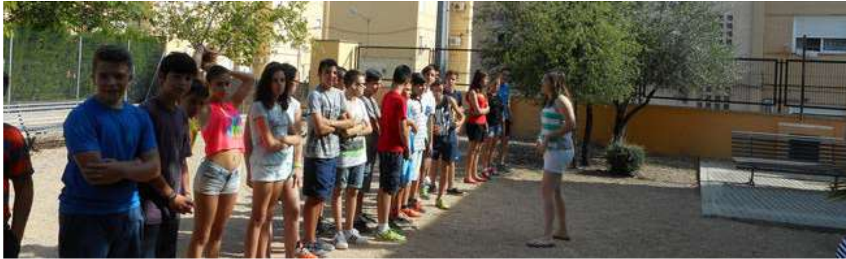
Projecte Socieducatiu Activa't! dintre de l'Estiu Jove a l'any 2016.